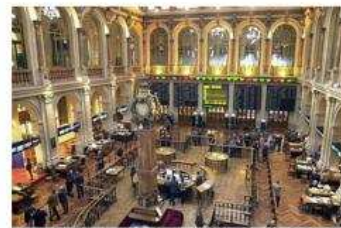
Cuando aumenta el Producto Interior Bruto.